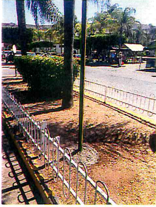
COLOCAR POSTE PARA SEÑALIZACION