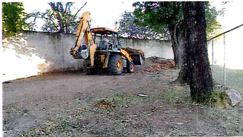
LIMPIEZA DE MATERIAL ORGANICO EN LA UNIDAD DEPORTIVA MUNICIPAL