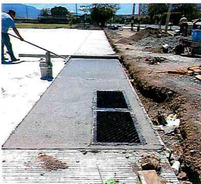
COLADO DE LOZAS PASEO COMERCIAL