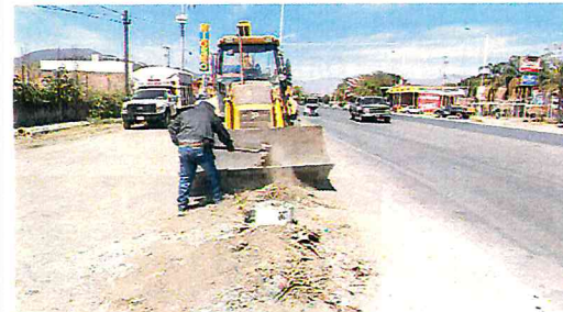
LIMPIEZA DE ESCOMBRO EN PERIFERICO