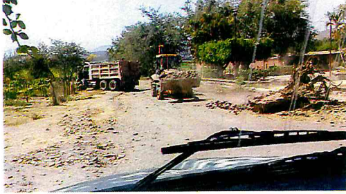
LIMPIEZA DE CALLES EN AYUQUILA