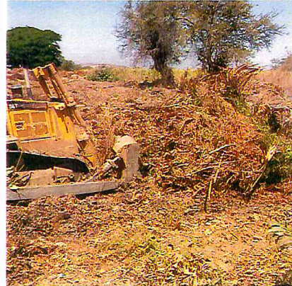
LIMPIEZA DE TERRENOS CON MAQUINA