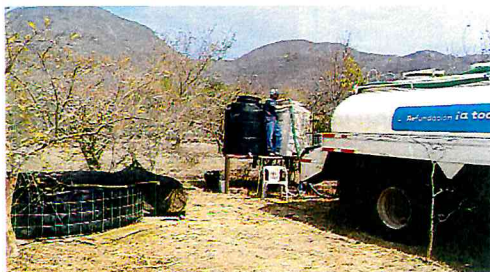
APOYO CON AGUA A GANADEROS