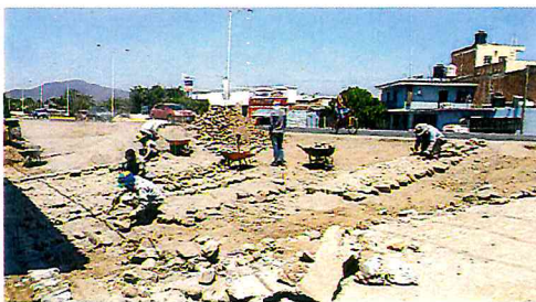
EMPEDRADO CIRC. ESQ. CON PRIV. DEL SOL