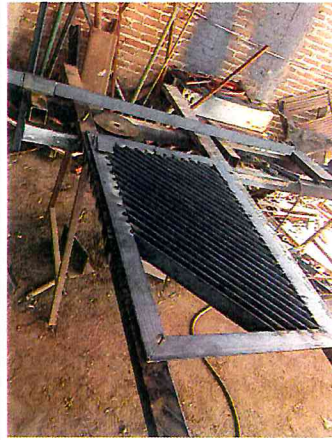
HACER REGILLAS PARA BOCA DE TORMENTA