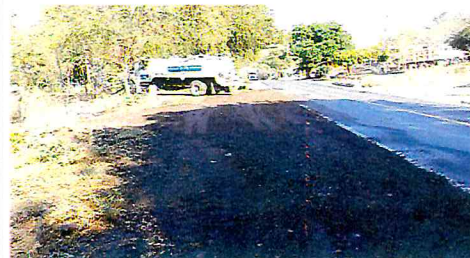
ACOMODO DE LATERAL EN AYUQUILA