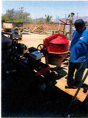
ACOMODAR Y ENGRASAR REVOLVEDORAS