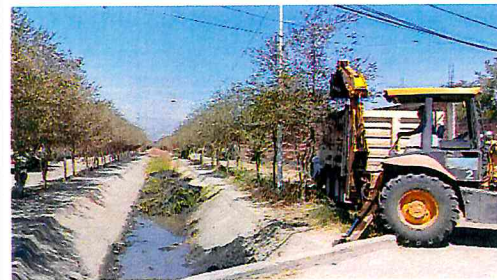
LIMPIEZA DE DREN EN CALLE JUAN CARBAJAL