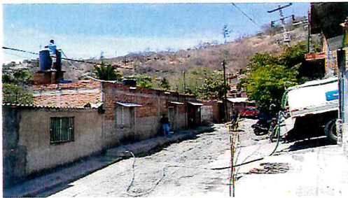
APOYO DE AGUA A VIVIENDAS DEL CERRITO