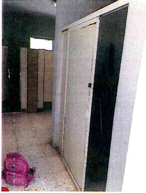
ACOMODAR PUERTA EN BAÑOS DE LA CASA DE LA CULTURA