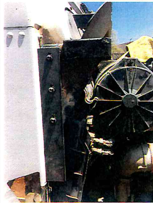
HACER BASE PARA COFRE DEL CAMION DE SADER