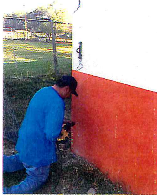
FIJAR MALLA CICLON A MURO EN LA UNIDAD DEPORTIVA MUNICIPAL