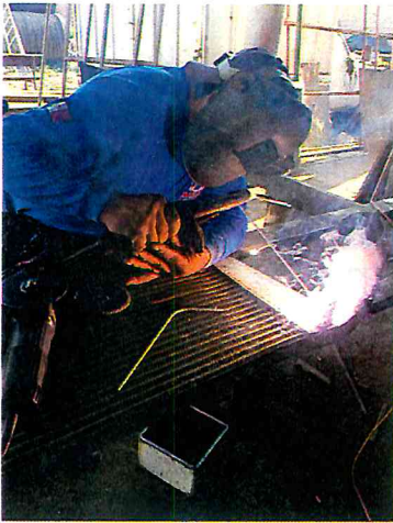
SOLDAR INTERCOL DE CAMION