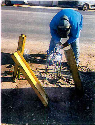
SOLDAR BASES PARA LAMPARAS