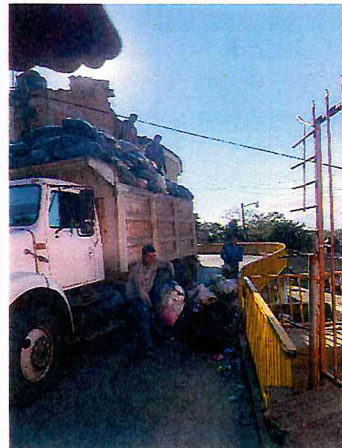
APOYO CON VOLTEO PARA REC. BASURA