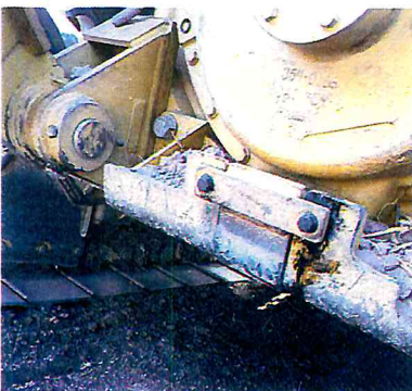
SOLDAR D6 DE SADER