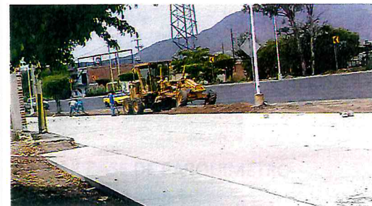
TRABAJOS EN EL PASEO COMERCIAL, CULTURAL Y DEPORTIVO