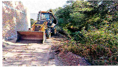
LIMPIEZA DE DREN EN LA COL. SAN PEDRO