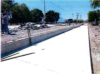
CONSTRUCCION DE CICLOVIA