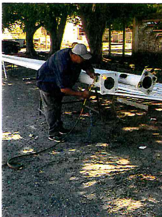
ACONDITIONAR POSTES DE ALUMBRADO